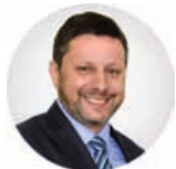
Предсједник Предраг Зорић

Трг Републике Српске 8 78000 Бања Лука Република Српска, БиХ +387 (51) 337 482