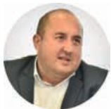
Предсједник Славен Гојковић

Трг Републике Српске 8 78000 Бања Лука Република Српска, БиХ +387 (51) 337 482