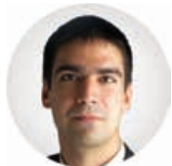
Предсједник Бојан Рисовић

Трг Републике Српске 8 78000 Бања Лука Република Српска, БиХ +387 (51) 337 482