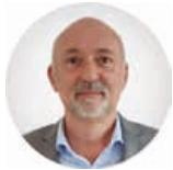
Предсједник Боско Борисављевић

Трг Републике Српске 8 78000 Бања Лука Република Српска, БиХ +387 (51) 337 482