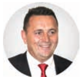
Предсједник Саво Ерић

Трг Републике Српске 8 78000 Бања Лука Република Српска, БиХ +387 (51) 337 482