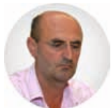
Предсједник Јанко Петровић

Трг Републике Српске 8 78000 Бања Лука Република Српска, БиХ +387 (51) 337 482