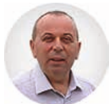
Предсједник др Милорад Зекић

Трг Републике Српске 8 78000 Бања Лука Република Српска, БиХ +387 (51) 337 482