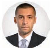
Предсједник Бојан Вуковић

Трг Републике Српске 8 78000 Бања Лука Република Српска, БиХ +387 (51) 337 482