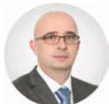
Предсједник Зоран Шкребић

Трг Републике Српске 8 78000 Бања Лука Република Српска, БиХ +387 (51) 337 482