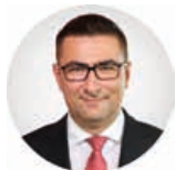
Предсједник Срђан Кондић

Трг Републике Српске 8 78000 Бања Лука Република Српска, БиХ +387 (51) 337 482