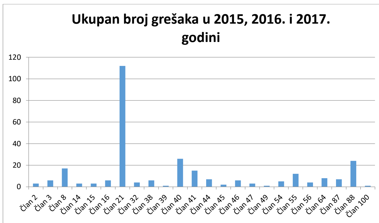
Grafikon 1: Ukupan broj grešaka

Iz prethodnog grafikona se može zaključiti da ugovorni organi prave greške u osnovnim elementima koji su bitni za provođenje postupka javne nabavke.